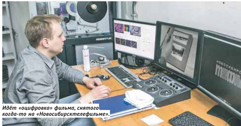
Идёт «оцифровка» фильма, снятого когда-то на «Новосибирсктеелефильме».

Отчётность по выполнению государственного задания с каждым годом становится всё более подробной и жёсткой, все работы, услуги и результаты деятельности должны иметь качественные показатели — иначе говоря, переведены в цифры. Но чтобы выполнить госзадание, оно должно быть чётко сформули-