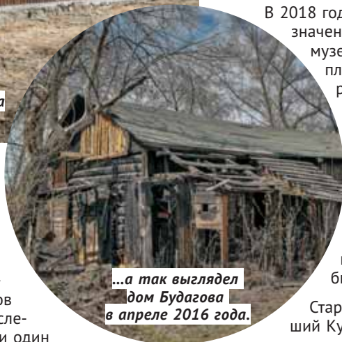
...а так выглядел дом Будагова в апреле 2016 года.

Дягилева. Теперь они могут вздохнуть с облегчением: этот дом включается в перечень выявленных объектов культурного наследия, а значит, ни один застройщик не сможет пре-