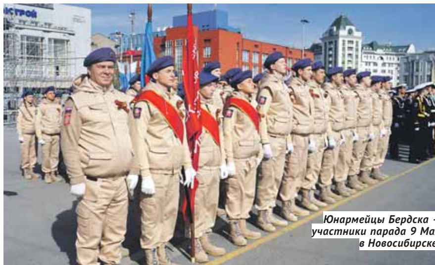
Юнармейцы Бердска — участники парада 9 Мая в Новосибирске.