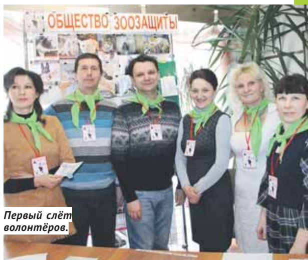
Первый слёт волонтеров.

Бердск — один из немногих городов России, где работает Общественная палата, сформированная в 2013 году. На территории Бердска активно работают около 150 общественных организаций, объединений во взаимодействии с органами власти, депутатским корпусом, муниципальными учреждениями, населением. В 2018 году сформирована инициативная группа по созданию ещё одной общественной организации — объединяются бердчане-колясочники. Бердск — это город с высокой гражданской активностью.