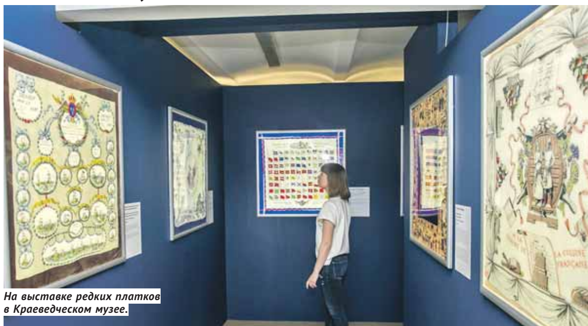
На выставке редких платков в Краеведческом музее.

В музеях, галереях и библиотеках Новосибирска выставочный бум.