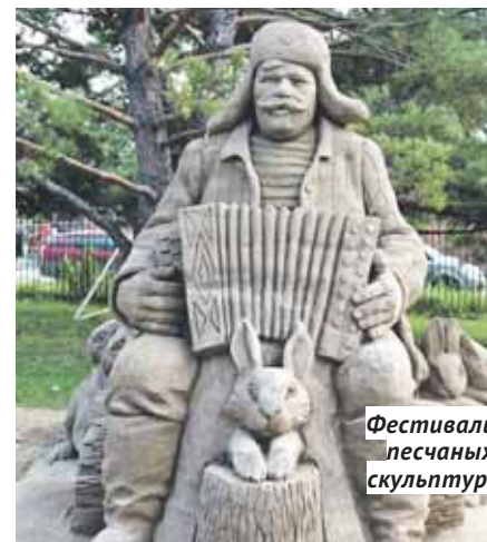
Фестиваль песчаных скульптур.

Система образования Бердска занимает ведущие места по многим показателям рейтинга муниципальных систем образования НСО. Образовательные организации принимают активное участие в реализации инновационных проектов. Стабильно высокие результаты, представленные на выставке образовательных достижений «УчСиб», за последние три года отмечены 4 большими золотыми, 19 малыми золотыми и 8 серебряными медалями. Ежегодно эффективные практики образования Бердска признаются победителями в конкурсе инновационных практик.