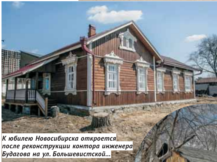
К юбилею Новосибирска откроется после реконструкции контора инженера Будагова на ул. Большевистской...