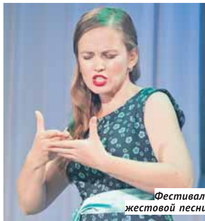
Фестиваль жестовой песни.

В Бердске проходят творческие фестивали экстренных служб «01–02–03». Их цель — повышение престижа работы в экстренных службах Бердска. Сотрудники служб представляют зрителям концертные номера, доказывая, что они талантливы не только в работе, но и в творчестве.